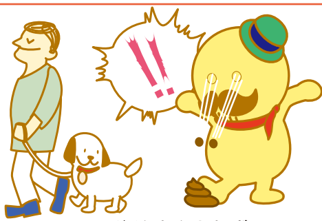
フンの後始末を忘れずに

水間寺の節分大法会に伴い、水間寺周辺の混雑が予想されます。警察官やガードマンなどの規制・指示・案内に、ご協力をお願いします。 節分日時 2月3日(日)午後1時～3時頃 問合せ先 貝塚警察署 ☎072-431-1234