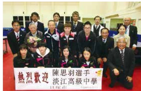
12月11日～15日 台湾の淡江高校が来日