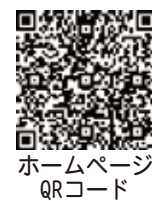
ホームページQRコード

市では、令和2年9月から新庁舎建設にかかる準備工事を行っています。今後、令和4年3月の工事終了、5月の供用開始に向け工事を進めていきます。 工事期間中は何かとご迷惑をおかけしますが、ご協力くださいますようお願いいたします。詳しくは、ホームページをご覧ください。