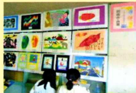
小学校での巡回展示の様子

図工・美術教育研究部の先生方により毎年実施の市内小中学校図画作品巡回展ですが、今年度の巡回展示に先駆けて市民文化祭においての展示が実現しました。児童生徒の想像力あふれる力作を是非ご観覧ください。