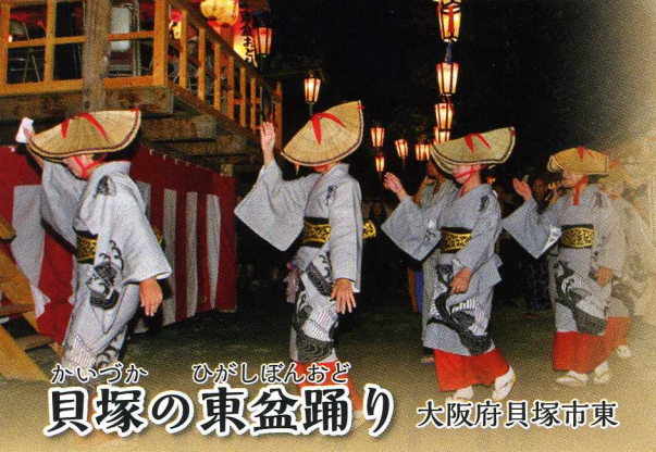
かいづか ひがしほんおど 貝塚の東盆踊り 大阪府貝塚市東