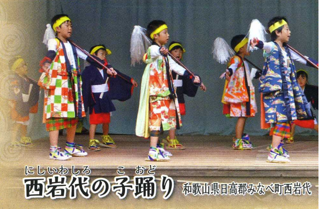
にしいわしる こおど 西岩代の子踊り 和歌山県日高郡みなべ町西岩代