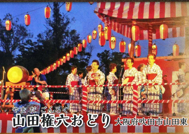
やまだ こんろく 山田権穴おどり 大阪府吹田市山田東