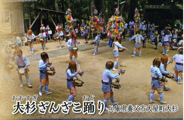
おおすぎ おど 大杉ざんざこ踊り 兵庫県養父市大屋町大杉