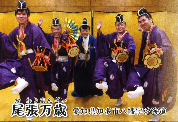
おわりまんざい 尾張万歳 愛知県知多市八幡字汐海道