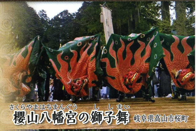
さくらやまはちまんぐう ししまい 櫻山八幡宮の獅子舞 岐阜県高山市桜町