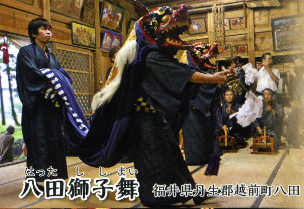
はった ししまい 八田獅子舞 福井県丹生郡越前町八田