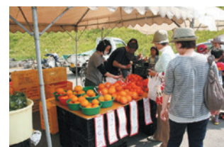
農業体験や地場野菜即売など 自然いっぱいの農業庭園「たわわ」