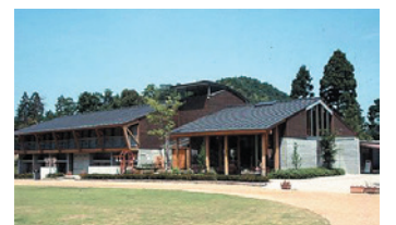
かいづか温泉リゾート「ほの字の里」