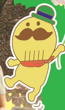
貝塚市イメージ キャラクター つげさん