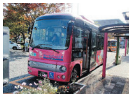
コミュニティバス 「は～もに～バス」