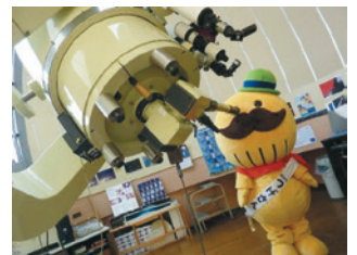
直径6.5mの天体観測ドームを備えた 天体観測施設「善兵衛ランド」