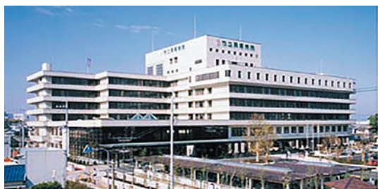
入院 249 床の 総合病院 「市立貝塚病院」