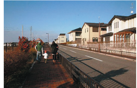
新しいまち「東山」のまち並み

臨海埋立地には大手企業が立地し、工業製品出荷額は 泉南地域(岸和田市以南)で一番!