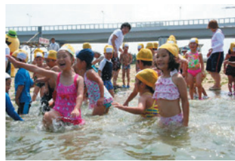
二色の浜海水浴場 海開き