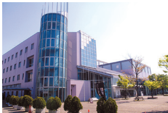
市民文化会館・コスモシアター