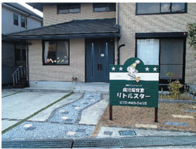
病児保育室 「リトルスター」

子どもの医療費は所得制限なし。 通院は小学6年生まで1日500円! 〔29年度からは中学3年生まで拡充〕 〔1医療機関あたり上限1,000円/月〕 入院は中学3年生まで1日500円。 入通院とも1か月の自己負担上限2,500円です。