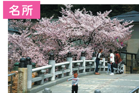
水間寺の満開の桜

目立たんけどもそこそこ住み良い。 なかなかええやん! 貝塚市。 住めば本当の良さがわかりますよ!