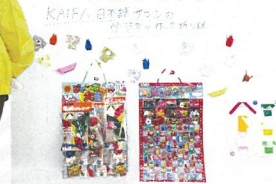
日本語サロン学習者のみんなが作った折り紙の展示も行いました!