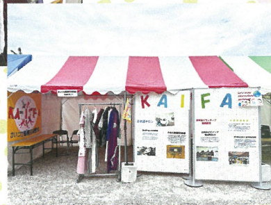
立ち止まってくださった方にはチラシを配布し活動の紹介をしました。