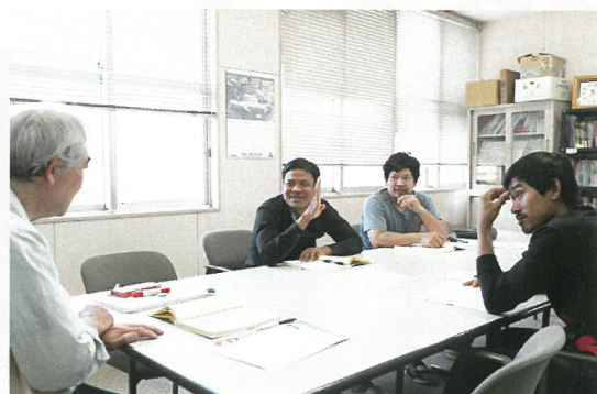
ほとんどの学習者が仕事をしながら、休日に日本語サロンへ来て日本語の学習を頑張っています