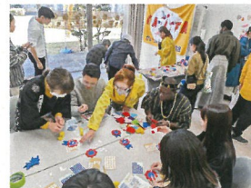
折り紙コーナーも大盛り上がりです。