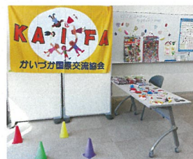
輪投げとくじ引きでお祭り体験!