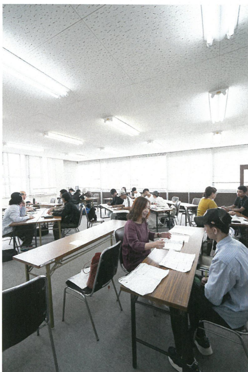
日曜日には特に多くの学習者がいます

日本語サロンでは日本語ボランティアとして活動して下さるサポーターを募集中です！ 平日の水曜日だけ、土日だけ、月に1回だけ などなど自由にご参加いただけます。見学也大歓迎です！