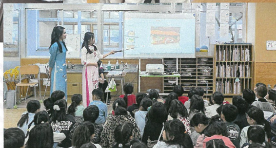
スライドを使用して自国についての紹介をします