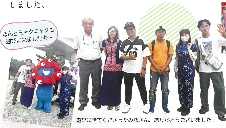
遊びに来てくださったみなさん、ありがとうございました!