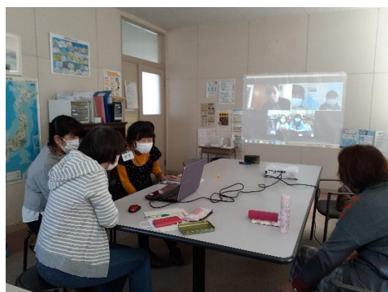
「台湾とのオンライン交流」まとめ

毎回興味深い発表がたくさんあり、KAIFA 側も貝塚の紹介ビデオを見てもらい、その後で質疑応答をして楽しく交流しました。