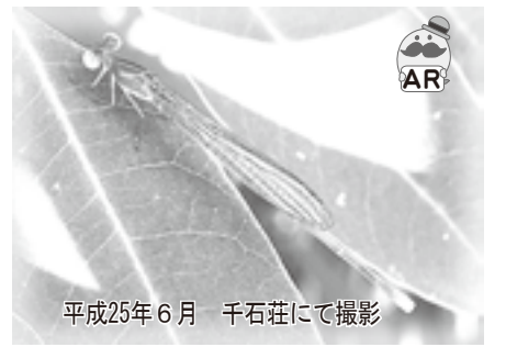
平成25年6月 千石荘にて撮影

前回のクロイトトンボは全体が黒色でした。ベニイトトンボは全体が赤色の全長35mm前後のイトトンボです。クロイトトンボが30mm前後なので、それよりやや大きいイトトンボと言えます。赤が目立つのですぐ見つけることができます。オスは鮮やか赤色ですがメスはオスのように赤くありません。6月~9月によく見られます。