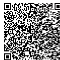
市HP(相談フォーム/シート)