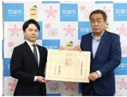
山田電器工業株式会社様