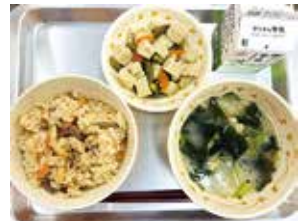
地産地消の献立例 (貝塚産三つ葉入りのみそ汁)

小学校給食は、栄養バランスがよだけでなく、地元食材の使用や趣向を凝らした料理・野菜の型抜きなど、子どもたちが食を通じて心身ともに健やかに成長できるよう工夫しています。