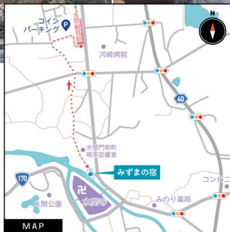
【住所】大阪府貝塚市水間 427 藪内かしの隣の

水間観音駅より水間厄除街道を歩いて徒歩8分ほど。 当日はフリー入場となります。お車でのご来訪の方は、 水間観音駅そばのコインパーキングをご利用ください。