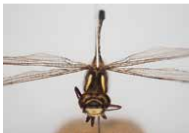
ムカシトンボの成虫

日本にはこんな個性豊かな固有種がたくさん暮らしています。日本は南北に長く、気候変動などから逃れるための移動が可能で、それが生物多様性の高さの一因ではないかともいわれています。すべての生きものは長い時間をかけて、絶妙なバランスの上で生きています。どうすれば日本の、地球の宝である大切な生きものを守れるのか、だれもが考えることのできる時代になるとよいですね。