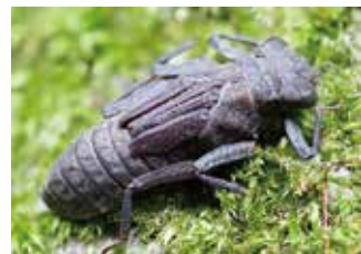
ムカシトンボのヤゴ

「固有種」という言葉をご存じですか?固有種とは特定の国や地域にしか生息・生育・繁殖しない生物学上の種です。日本は、およそ陸にすむ哺乳類の4割、爬虫類の6割、両生類の8割が固有種で、その割合が高いことが特徴です。