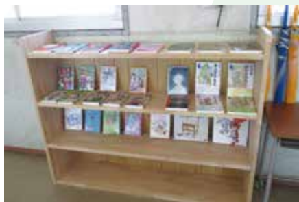
葛城校区 校区活動の様子

小学校区単位で、地域住民同士のつながりを深め、暮らしやすいまちづくりを実現することを目的に小学校に学級文庫を寄贈したり、二色の浜や津田川の清掃活動をしたり、様々な活動を行っています。