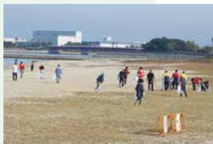
西校区 校区活動の様子