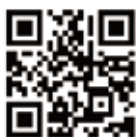
町会連合会ホームページ

町会連合会ホームページの充実を図り、校区や町会・自治会の活動などについて情報発信しています。