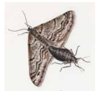
シロフフユエダシャク (左:オス, 右:メス)

彼らに会いたくなかったかた、寒さに負けず探しに行ってください。 寒くて暗くて泣きそうになる冬の夜、彼らは命尽きるまで、次 の世代を残そうと懸命に生きています。冬にもたくさん命が潜ん でいますよ。