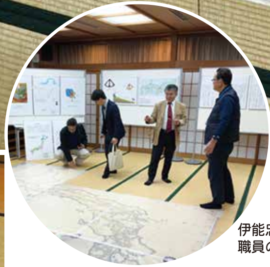
伊能忠敬記念館の館長をはじめ、職員の皆様が視察に来られました