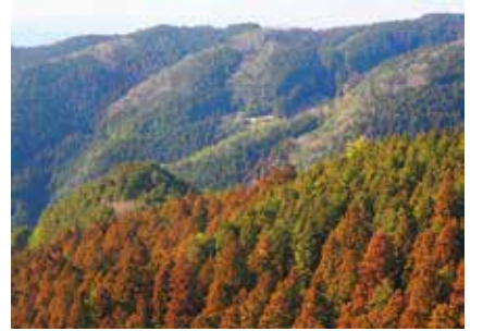
和泉葛城山