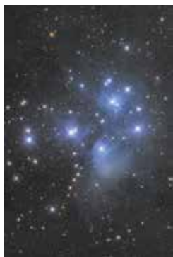
プレアデス星団(すばる)

冬の星座の一番手、おうし座が東の空からのぼってきます。赤い目をしてオリオン座をにらんでいるといわれる「おうし」の顔がV字の部分で、その中にある