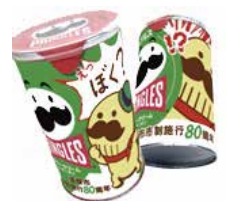
市制施行80周年記念 オリジナルデザインプリングルズ