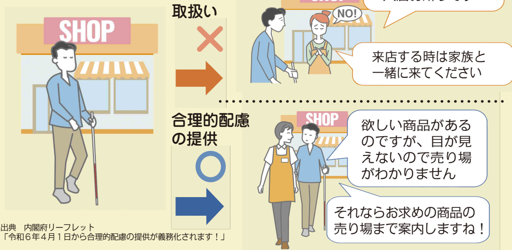
出典 内閣府リーフレット 「令和6年4月1日から合理的配慮の提供が義務化されます！」

合理的配慮とは…障害のある人とない人が、同じく平等な社会生活を送れるよう、社会的障壁を排除することです。