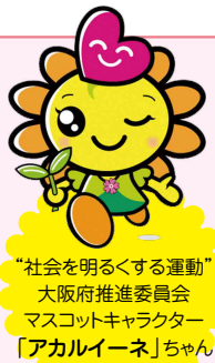
“社会を明るくする運動” 大阪府推進委員会 マスコットキャラクター 「アカルイーネ」ちゃん