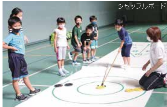
シャッフルボード