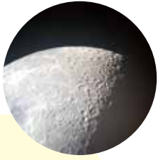
スマホで撮影した月の写真