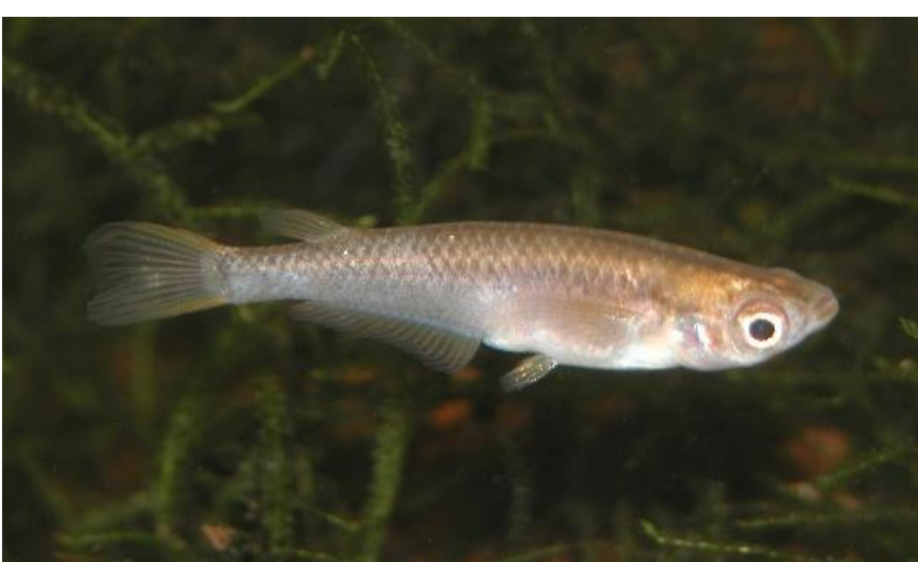
絶滅危惧種のめだか