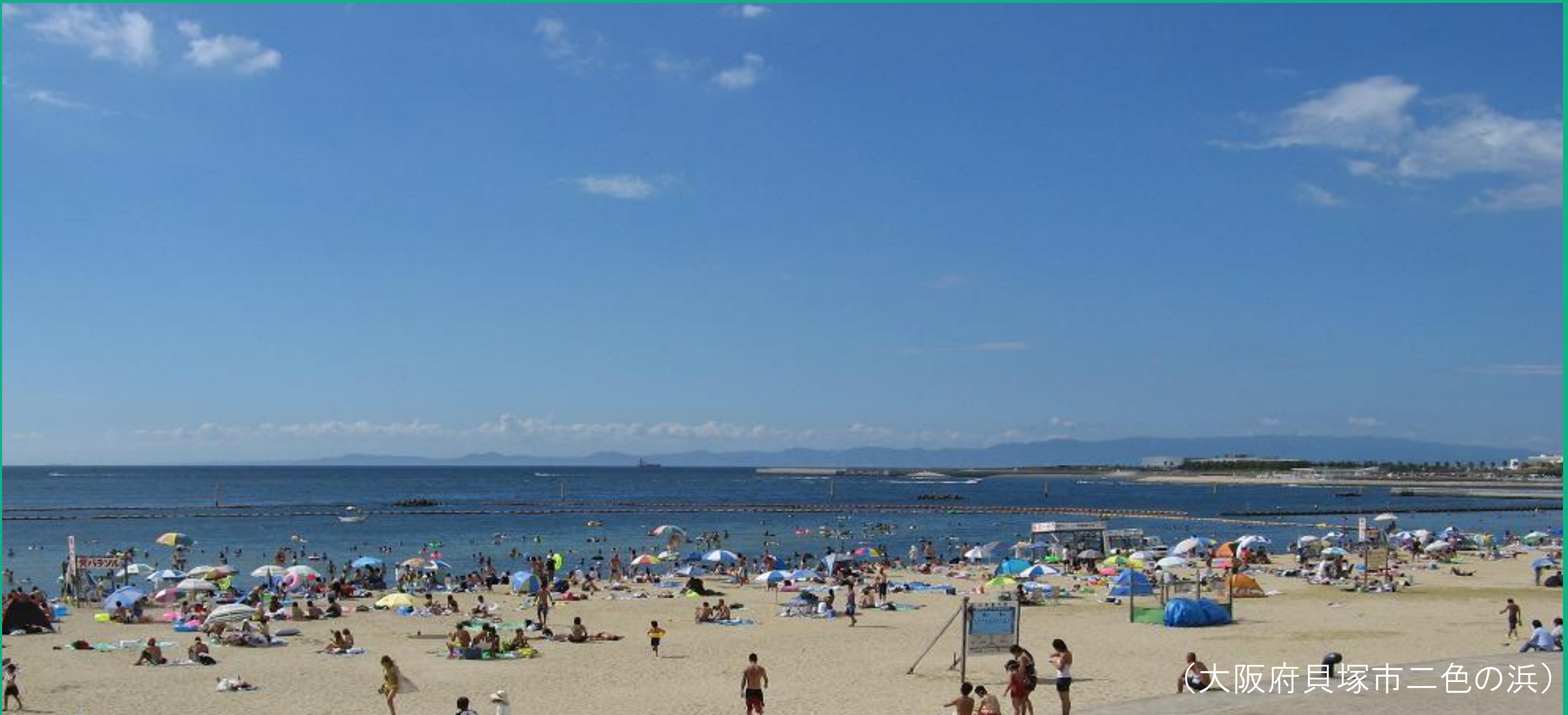
(大阪府貝塚市二色の浜)

○昭和63年に着手し、生活環境の改善と水質保全などを 目指し、南大阪湾岸流域関連公共下水道として下水道整備 を推進。 ※貝塚市の下水道普及率 平成16年度末 38.1% → 平成26年度末 56.9%