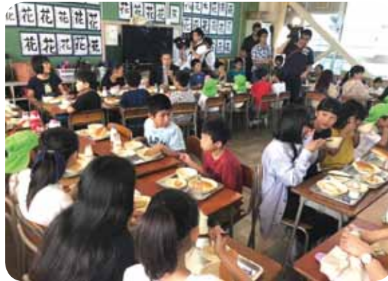
中央小学校での給食の様子