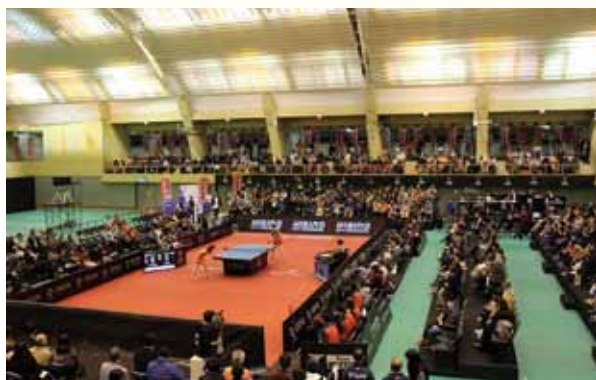
昨年、総合体育館でTリーグ開催

2018 年に卓球の新リーグTリーグが創設され、貝塚市を練習拠点とする日本生命レッドエルフが参戦し、今年、3 月 17 日開催されました「Tリーグファイナル 2018 - 2019 シーズンプレーオフファイナル」において木下アビエル神奈川を下し初代王者に輝きました。