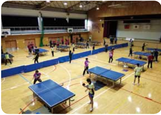
第二中学校で卓球交流