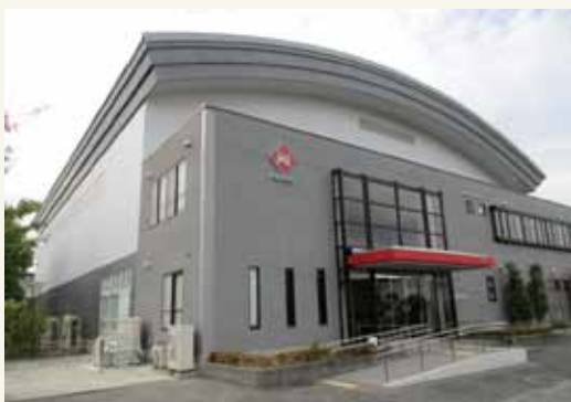
現在の日本生命体育館