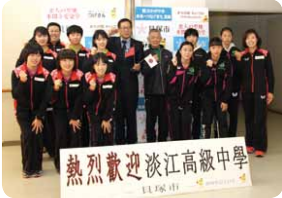
台湾淡江高校が貝塚市役所を訪問

台湾淡江高校の卓球部の選手・コーチを貝塚市に招き、日本生命体育館で日々練習を重ね、世界で戦える選手を目指しているジュニアアシスト卓球アカデミー生とともに市内中学生たちと卓球を通じた交流を行いました。