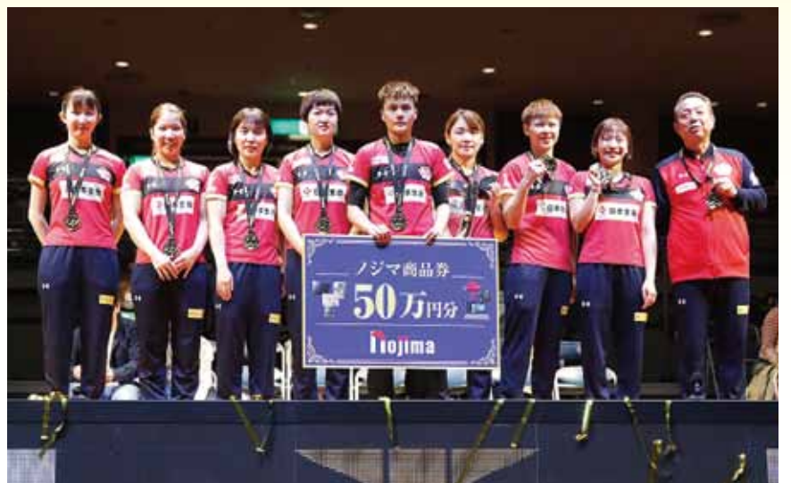
Tリーグ初代王者に輝いた日本生命レッドエルフ