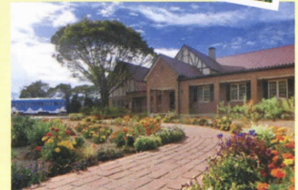
イタリアンレストラン 森の小径