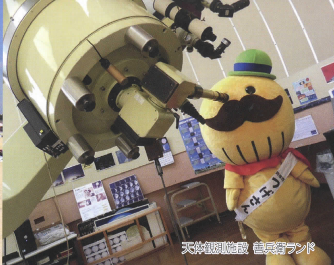
天体観測施設 善兵衛ランド