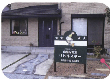
病児保育室「リトルスター」

病児保育も1日2,000円で利用できます。 子育て世代を応援するメニューが充実しています。