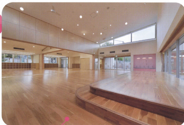
葛城認定こども園

保育所・認定こども園の待機児童ゼロ! (平成30年度実績) 認定こども園をますます充実し、地域の子育て支援の場としても活用。公立幼稚園は3歳児から入園でき 預かり保育も午後4時半まで開設。 学童保育は、小学6年生まで受入可。 お父さん、お母さんも安心して仕事ができます。