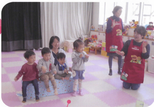
子どもの一時預かりも可能な、子育て支援センター「ひだまり」

妊婦(7ヶ月)及び0~2歳児の保護者を対象に、子どもの一時預かりや家事援助サービスを受ける際などにご利用いただける「子育て応援券」を給付。インフルエンザなど任意の予防接種にも利用できます。 子ども医療費は、通院・入院ともに中学3年生まで対象で、所得制限なし。