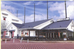
くら寿司 セントラルキッチン (東貝塚店)