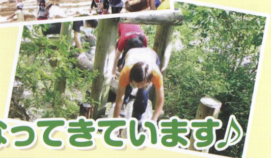
アスレチック スポーツ