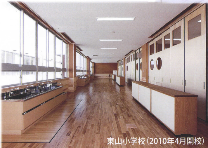
東山小学校 (2010年4月開校)

東山(東山小学校区)では入居世帯が1,200戸を超え、 現在も民間不動産会社による戸建住宅分譲中！！