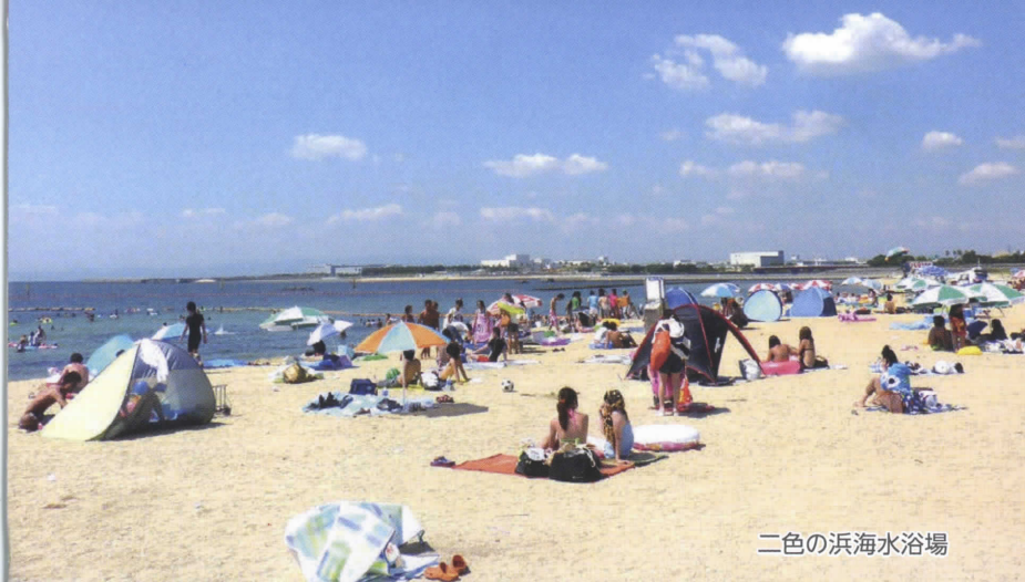
二色の浜海水浴場