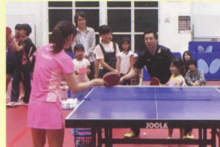
日本生命 (女子卓球部)