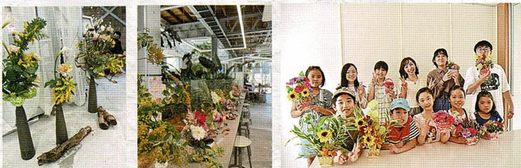
2023年第4回花展の様子

花育教室の子ども達とアレンジメント教室の生徒の皆さんで会場を花爛漫にコーディネート。春のお花をお楽しみください。マルシェも同時開催♪