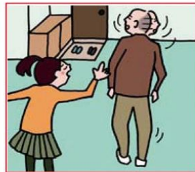
目を離せない家族の見守りなどのケアをしている