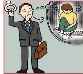
障害や病気の家族の世話や介護をいつも気にかけている

©一般社団法人日本ケアラー連盟 / illustration : Izumi Shiga