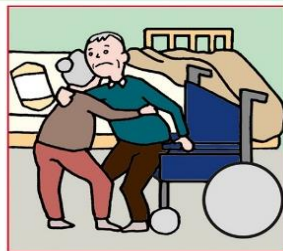
健康不安を抱えながら高齢者が高齢者をケアしている