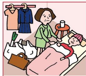
仕事と介護でせいじっぱいでほかに何もできない