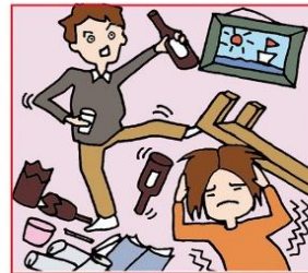
アルコール・薬物依存やひきこもりなどの家族をケアしている