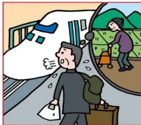
遠くにひとりで住む高齢の親が心配で頻りに通っている