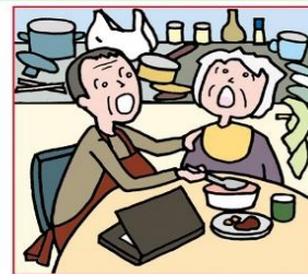
仕事を辞めてひとりで親の介護をしている