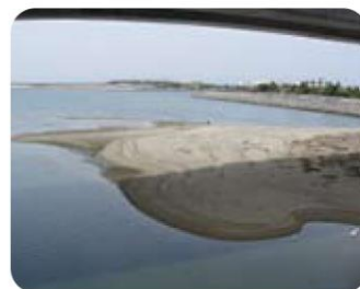
2008年 3月 2日