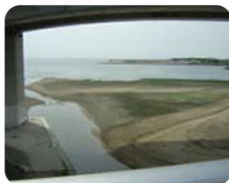
2007年 6月 1日