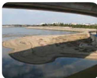
2008年 1月 4日