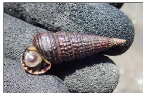
図 2. カワアイ （近木川干潟再生地 2022 年 5 月 4 日採集）