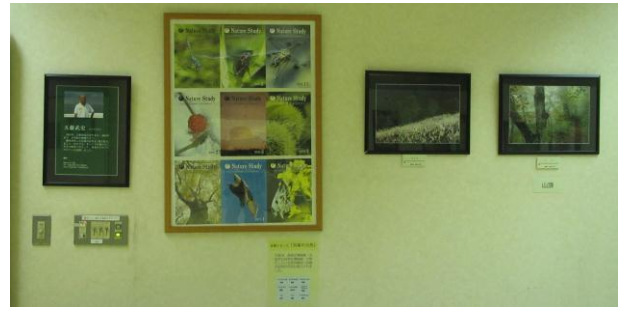
五藤武史写真展「貝塚の自然」会場