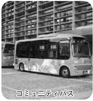
コミュニティバス

【問】水間鉄道については、存続、発展させるべく努力されている最中ですが、路線が短く利用者の拡大は思うように進んでいないのが現状だと思えます。また、コミュニティバスについては、不便、金額が高いなどの不満の声を多く聞きます。このように、公共交通を取り巻く環境は厳しいですが、水間鉄道とコミュニティバスがコラボレーションすることにより、新たに需要をつくることのできる