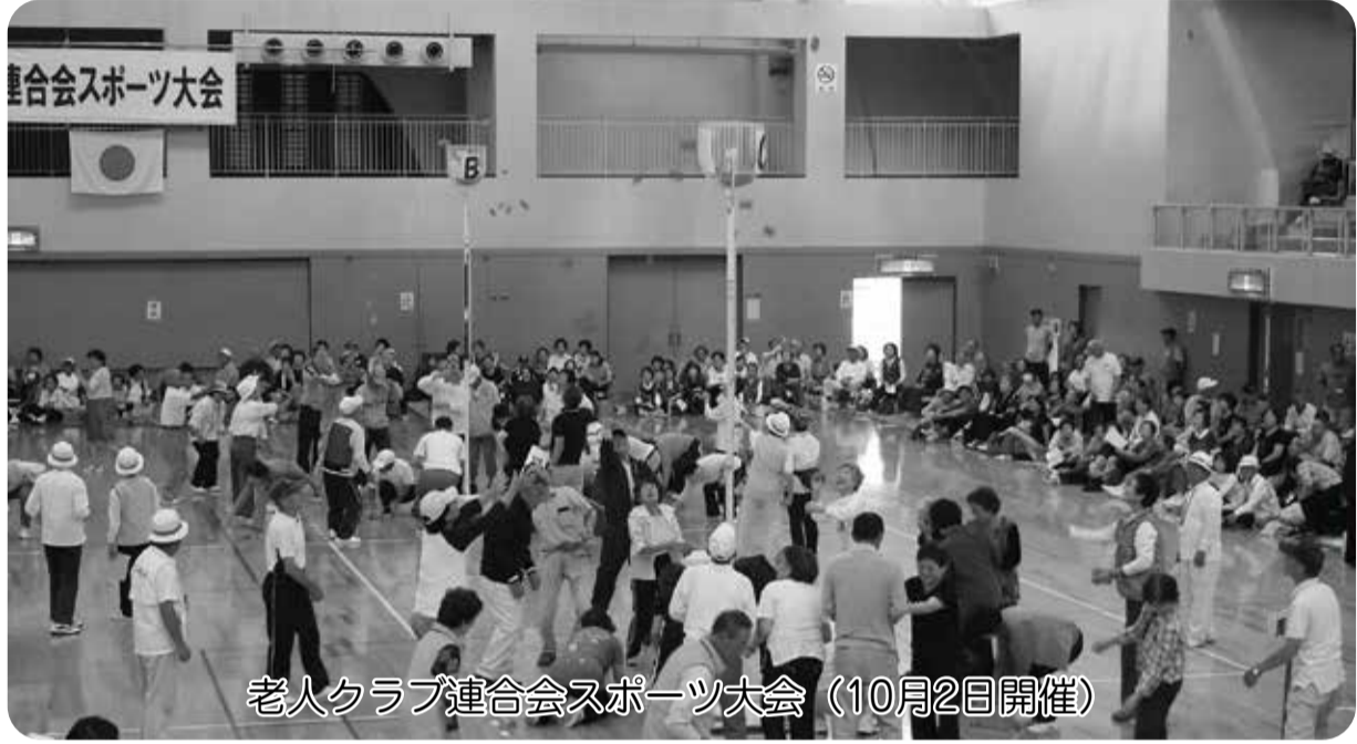
老人クラブ連合会スポーツ大会 (10月2日開催)