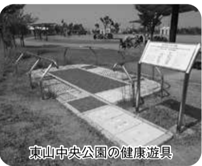
東山中央公園の健康遊具

また、認定こども園への移行にあたっては、カリキュラムを組んで、現場に混乱が起きないように準備していきたいと考えています。