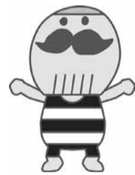
貝塚市イメージキャラクター つげさん

【問】昨年、市のイメージキャラクターを公募し、特産品のつげ櫛をモチーフとした「つげさん」が市民の方々の投票で選ばれましたが、ゆるキャラが盛り上がるためには、子どもや女性たちを巻き込まなければ難しいことだと思います。