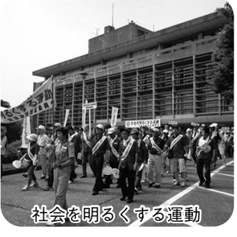
社会を明るくする運動

【答】青少年の非行防止については、市内の各種団体、関係機関で構成する「青少年問題協議会」を組織しており、小学校区を単位とした家庭・