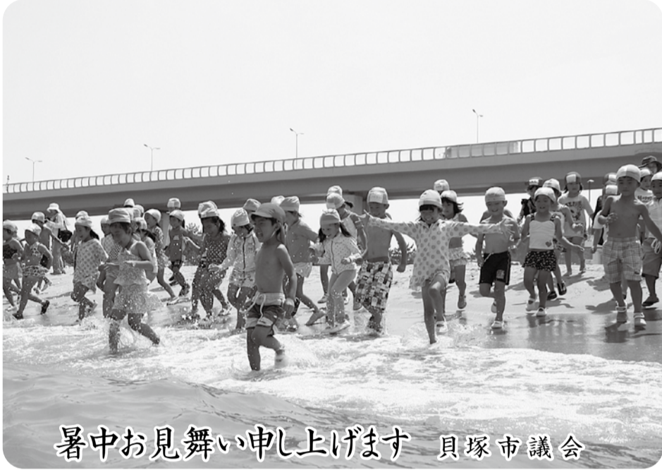
暑中お見舞い申し上げます 貝塚市議会

平成25年第2回(6月)定例会は、6月11日から21日までの11日間の会期で開催しました。本定例会には、市税条例の一部改正をはじめ、議案13件、繰越明許費繰越報告の件などの報告11件が提出され、可決・修正可決・承認・同意しました。また、6月17日に市民から提出された久保町JR阪和線高架下に関する請願を採択しました。