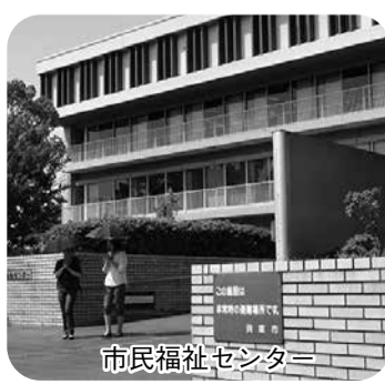
市民福祉センター

【答】①本市の平成25年3月時点の生活保護受給者数は、1137世帯、1603人と