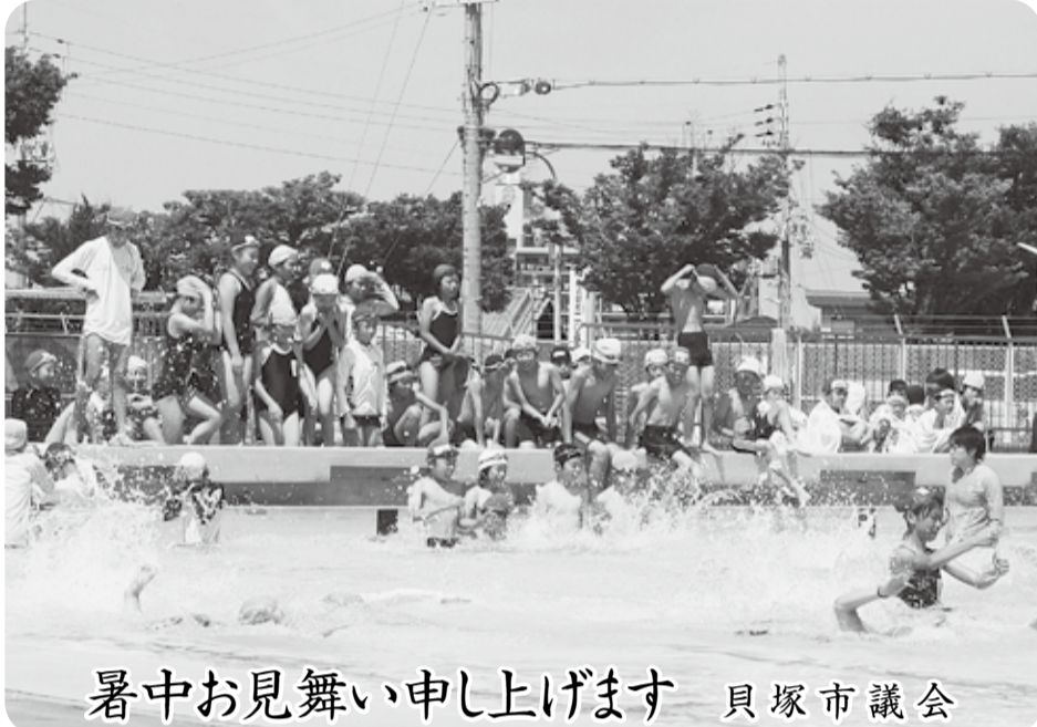
暑中お見舞い申し上げます 貝塚市議会

平成24年第2回(6月)定例会は、6月11日から22日までの12日間の会期で開催しました。本定例会には、貝塚市暴力団排除条例の制定をはじめ、議案15件、繰越明許費繰越報告の件などの報告10件、また、議会議案として議員の議員報酬、費用弁償等に関する条例の一部改正と意見書2件が提出され、原案どおり可決・承認・同意・賛成しました。