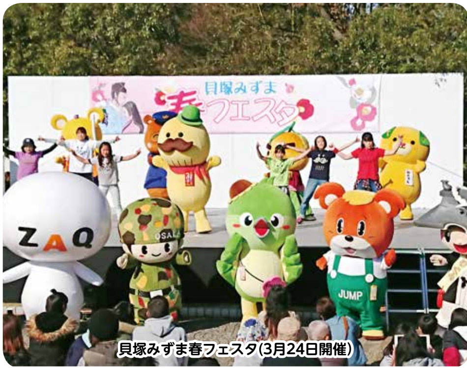
貝塚みずま春フェスタ(3月24日開催)

平成31年第1回(3月)定例会は、2月20日から3月19日までの28日間の会期で開催しました。本定例会には、請願処理などの報告3件と、個人情報の保護及び情報公開に関する条例の一部改正の件などの議案28件が提出され、原案どおり可決・承認しました。