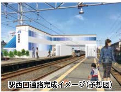
駅西口通路完成イメージ(予想図)