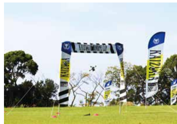
市立ドローン・クリケットフィールドで開催されたドローンレースの様子(9月23日撮影)