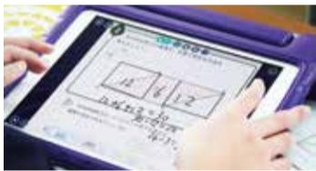
タブレットを使った学習

他にも、登校前の検温や健康チェック、登校後の体調不良時の迎えなど、学校園が感染元とならないよう、2学期以降も各家庭との連携や協力依頼を引き続き行ってまいります。