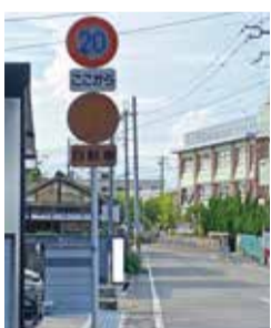
中央小学校前の消えかけた標識

【問】中央小学校正門前の通学路約800メートルが車の抜け道となっており、スピードを出す車が見られます。この区間にスクールゾーン表示が1箇所しかないのでは増やすことはできませんか。