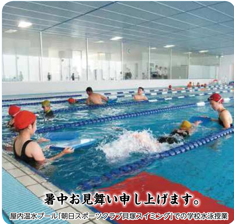
暑中お見舞い申し上げます。

令和2年第2回(6月)定例会は、6月16日から29日までの14日間の会期で開催しました。 本定例会には、処分報告などの報告7件と、市税条例の一部改正の件などの議案25件が提出され、原案どおり可決・承認し、人事案件については同意・賛成しました。また、議会議案として、環境保全条例の一部改正案を可決し、市議会議員の議員報酬、費用弁償等に関する条例の一部改正案は否決しました。