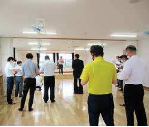
市立津田認定こども園

6月18日に厚生文教常任委員会主催で、耐震補強改修及び増改築を行った市立津田認定こども園の現場視察を行いました。