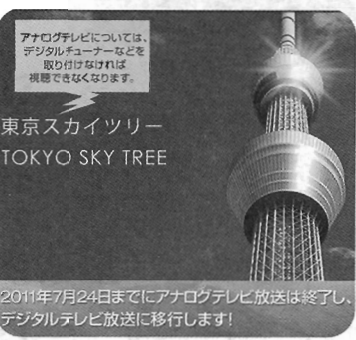
もうすぐ地デジへ