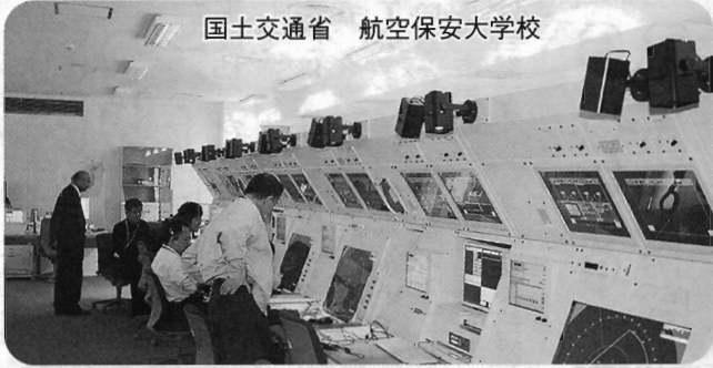
国土交通省 航空保安大学校

11月25日に関西国際空港問題特別委員会主催で関西国際空港2期島などの現地視察を行いました。 この日は、平成20年4月にりんくうタウンに移転開校した国土交通省航空保安大学校で、管制実習室やレーダー管制実習室などの視察を行った後、関西国際空港において関西国際空港株式会社から関西国際空港の現況報告を受け、その後、2期貨物地区などの視察を実施し、関西国際空港の活性化と、そのインパクトを生かした空港近隣市としての調査研究を行いました。