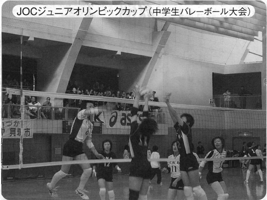
JOCジュニアオリンピックカップ(中学生バレーボール大会)

〒597-8585 畠中1丁目17番1号 電話(433)7311 メール gikai-h@city.kaizuka.lg.jp