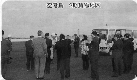
空港島 2期貨物地区

11月25日に関西国際空港問題特別委員会主催で関西国際空港2期島などの現地視察を行いました。 この日は、平成20年4月にりんくうタウンに移転開校した国土交通省航空保安大学校で、管制実習室やレーダー管制実習室などの視察を行った後、関西国際空港において関西国際空港株式会社から関西国際空港の現況報告を受け、その後、2期貨物地区などの視察を実施し、関西国際空港の活性化と、そのインパクトを生かした空港近隣市としての調査研究を行いました。