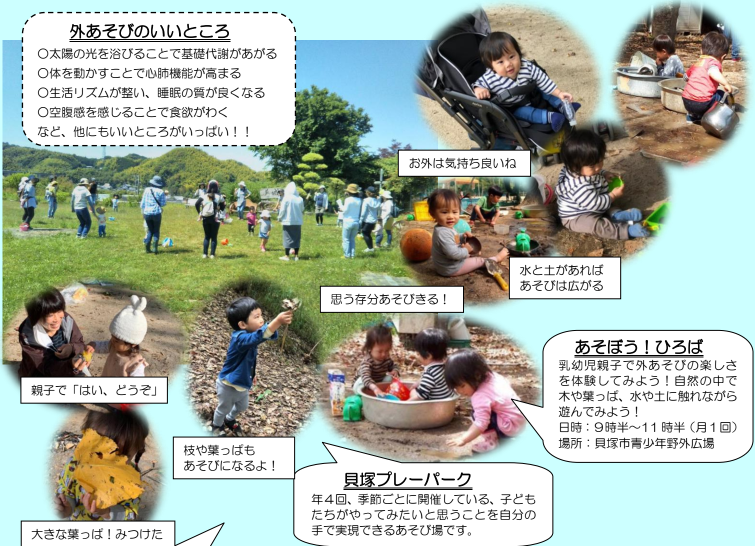
お外は気持ちいいね