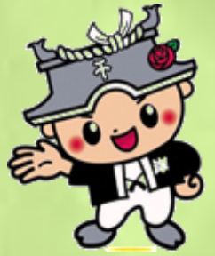
岸和田市CEOちきりくん