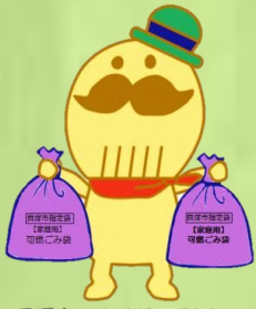
貝塚市イメージキャラクター つげさん

岸和田市、貝塚市、岸和田市貝塚市広域事務組合が連携し、 両市民のごみの 3R (廃棄物の発生抑制・再利用・再資源化)に 関する知識を深め、「資源循環型社会の形成」を目的としています。