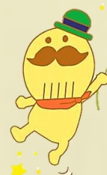
貝塚市イメージキャラクター つけさん