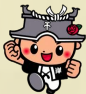
岸和田市CEOちきいくん

クイズに挑戦するとエコバッグがもらえるよ！ エコバッグに好きな絵をかい てオリジナルエコバッグを作ろう！ ※なくなり次第終了とします。