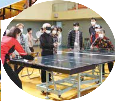
サウンドテーブルテニス