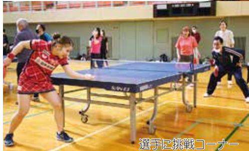
選手に挑戦コーナー