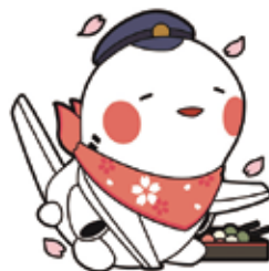
SORAYAN