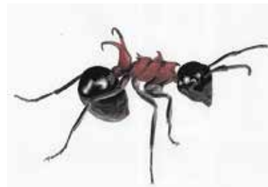
自然遊学館へよく来館されるかたのイラストです

アリといえば、みなさんはどのようなイメージをもちますか。トゲアリはその名の通り、トゲが背中にあるカッコいいアリです。アリの生態は興味深いものがありますが、トゲアリは特にすごいです。なぜなら他のアリの巣を乗っ取ってしまうのです。普通、同じ種類のアリでさえ、まちがって別の巣に近づいたら、住んでいるアリに攻撃されてしまいます。それなのに、交尾を済ませたトゲアリの女王はムネアカオオアリやクロオオアリの巣をねらって侵入します。 まずは侵入者だとばれないように、その巣のアリの匂いを身にまといまいます。つまり、アリは視覚というよりも、において仲間を識別しているのです。そして、もともといた女王を殺し、自分が女王としてその巣のアリを使って子育てするのです。トゲアリの女王が産んだ卵を、もともといた働きアリが自分たちの子どもだと思い込んで世話をします。すると、あれよ、あれよという間に、トゲアリの大家族ができあがってしまいます。なんてズル賢いのでしょうか。どうやってこんな生存戦略を考え、遺伝子の記憶に刻み込んだのでしょうか。小さな体なのに、やることのスケールが大きいです! これからも身近な昆虫の壮大なストーリーに心を寄せてみてくださいね。1年間アリがとうございました。