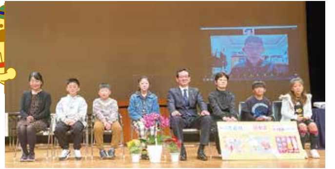
エッセイ部門 表彰式