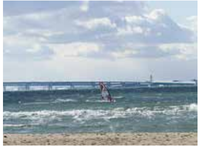
冬の二色の浜