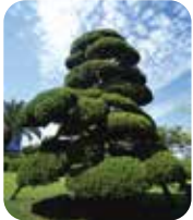
市の木 カイツカイブキ