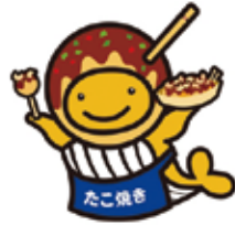
たご焼きクーちゃん

サマージャンボ宝くじの当選金は、1等・前後賞合わせて7億円!サマージャンボにも同時発売!! サマージャンボ宝くじの収益金は、市町村の明るく住みよいまちづくりに使われます。 インターネットからも宝くじが買えます!詳しくは「宝くじ公式サイト」を検索! 発売期間 7月5日(火)〜8月5日(金) 問合せ先 (公財)大阪府市町村振興協会 ☎06・6941・7441