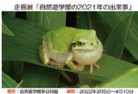
企画展「自然遊学館の2021年の出来事」 場所: 自然遊学館多目的室 期間: 2022年3月5日~4月10日

▶期間 3月5日(土)~4月10日(日)▶場所 館内多目的室 ※火曜は休館日です。