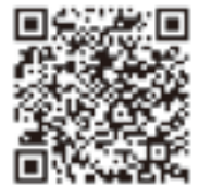
詳しくは、専用ホームページをご覧ください