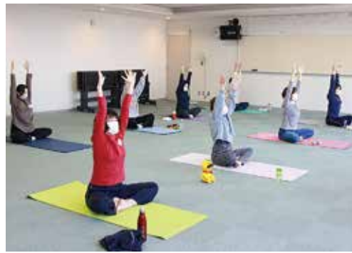
◆ママヨガで気分はリフ レッシュ！

場所・問合せ先 子ども福祉課(保健・福祉合同庁舎 1階) ☎072-433-7022