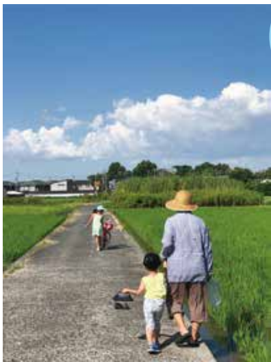
「夏休み、ひいばあちゃんと虫取りざんまい」