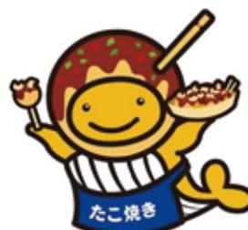
たこ焼きクーちゃん

カンボジアの地雷被害を無くすため、書損じハガキなどを集めて換金し、地雷撤去団体へ寄付しています。ハガキ2～3枚で1㎡の地雷撤去費用になります。 対象品 書損じ・未使用ハガキ、未使用切手、未使用テレカ、QOカードなど 期間 来年3月31日必着 送付・問合せ先 〒814-0002 福岡県福岡市早良区西新1-7-10 702(一財)カンボジア地雷撤去キャンペーン ☎092-833-7575