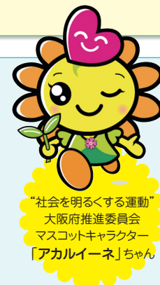
“社会を明るくする運動” 大阪府推進委員会 マスコットキャラクター 「アカルイーネ」ちゃん