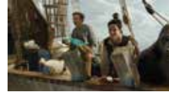
ドクター・ドリトル