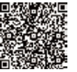
ホームページ QRコード