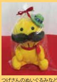
つげさんのぬいぐるみなど

メールでの応募 hit@obc1 3 1 4 .co.jp 「Hit & Hit! 係」 ハガキでの応募 〒5 5 2 - 8 5 0 1 ラジオ大阪「Hit & Hit! 係」