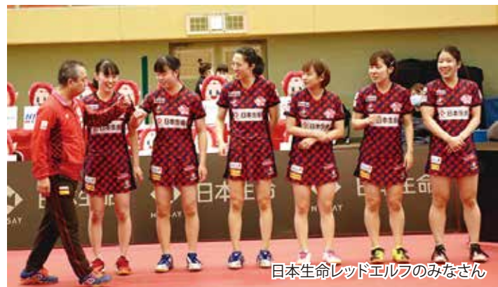
日本生命レッドエルフのみなさん