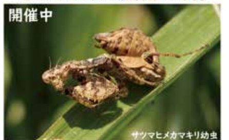
「2020年版」自然遊学館にて4月4日まで

昨年の、市の動植物の記録や自然遊学館の行事を、写真や標本で振り返ります。 ▶期間 4月4日(日)まで▶場所 館内多目的室