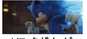
ソニック・ザ・ムービー