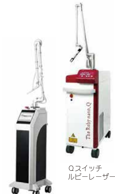
炭酸ガスレーザー