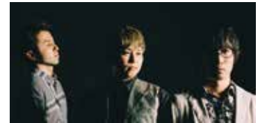
fox capture plan

「FUJI ROCK」"SUMMER SONIC"にも出演。 「現代版ジャズ・ロック」をコンセプトに掲げ、常に時代を先取る彼らのステージをぜひ、生でお楽しみください。