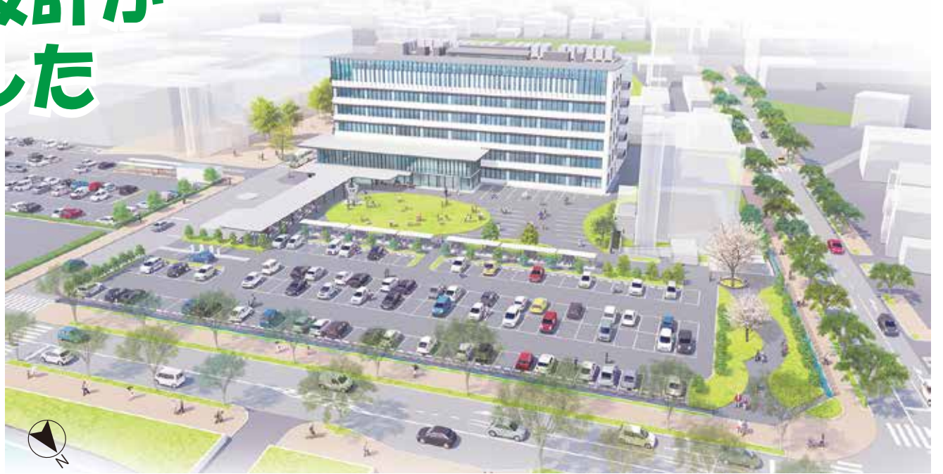
新庁舎イメージ図