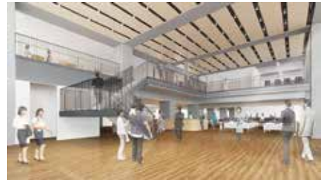
エントランスイメージ図