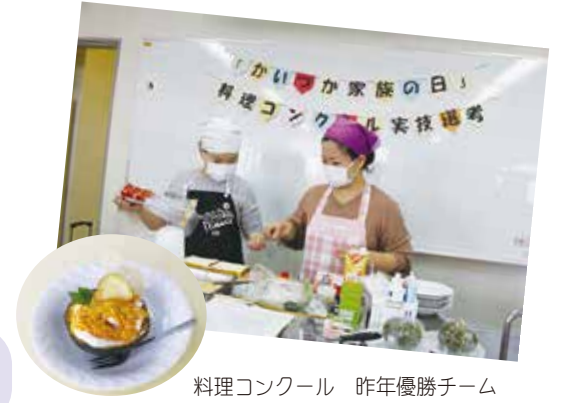
料理コンクール 昨年優勝チーム

応募・問合せ先 〒597-8585 畠中1-17-1 社会教育課 ☎072-433-7125、Eメール kazoku@city.kaizuka.lg.jp