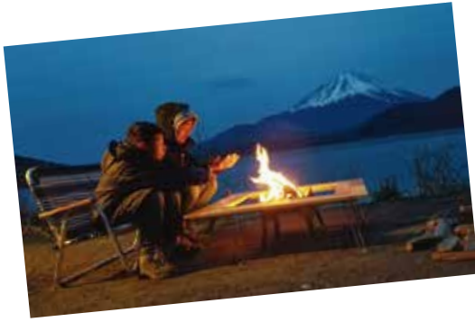
写真の部 昨年最優秀賞作品