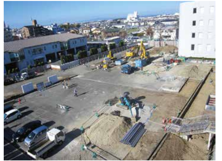
新庁舎建設予定地の状況 (11月24日撮影)