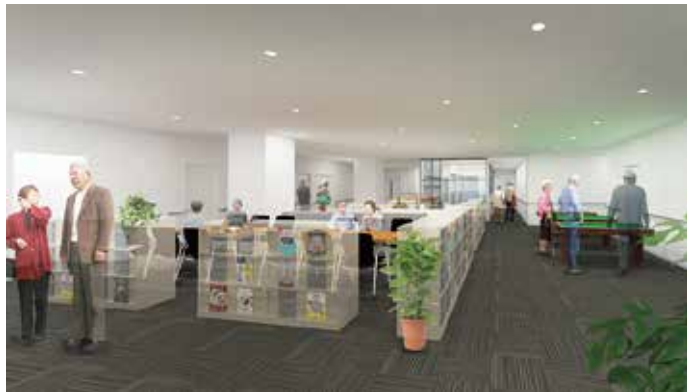
老人福祉センター交流ロビー イメージ図